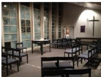
St. Th. Morus: Marienkapelle; Foto: S.W.

Am Dienstag, 25. März (Hochfest Verkündigung des Herrn),