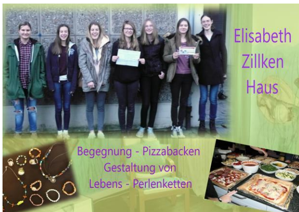
Elisabeth Zillken Haus

Begegnung - Pizzabacken Gestaltung von Lebens - Perlenketten