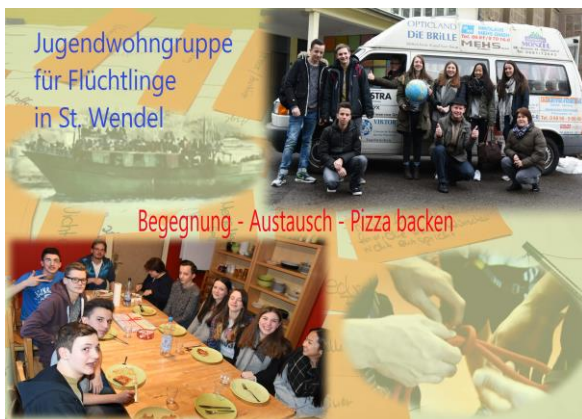
Jugendwohngruppe für Flüchtlinge in St. Wendel