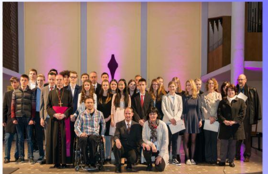
Firmung in Saarbrücken 13.03.2016