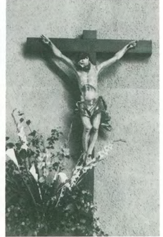
Altarkreuz, 1974 von einer Familie der Gemeinde gestiftet. Aus der Expertise: Das holzgeschnitzte Corpus stammt aus Süddeutschland, 18. Jahrhundert.