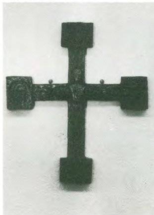
Bronzekreuz aus dem Gemeindesaal, Bronzearbeit aus dem Karlsruher Raum, um 1935.