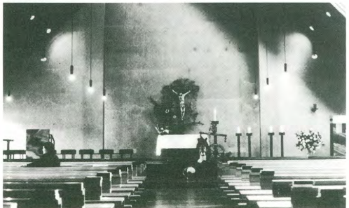
Innenraum der Kirche, zum Erntedankfest 1976 geschmückt.